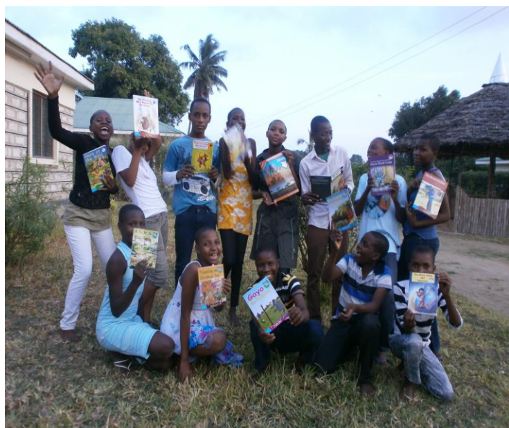
Voor alle kinderen een boek